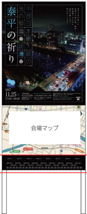
イベント告知看板

※デザインはイメージ（昨年のも）です。実際には2018年度のデザインに変更になります。 ※掲載する文字・ロゴの大きさは協賛金額、協賛数によって変わりますのでご了承ください。