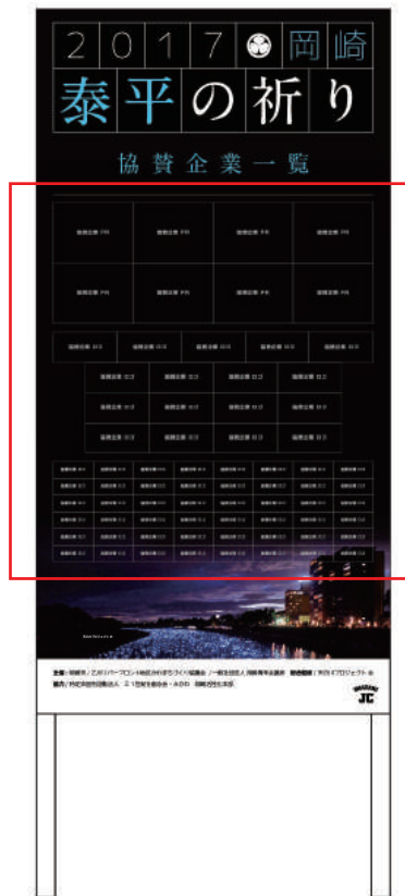
協賛企業（団体）・個人名一覧看板

協賛企業（団体）・個人名一覧看板には個人協賛いただいた方の氏名も掲載されます。 ※希望者のみ